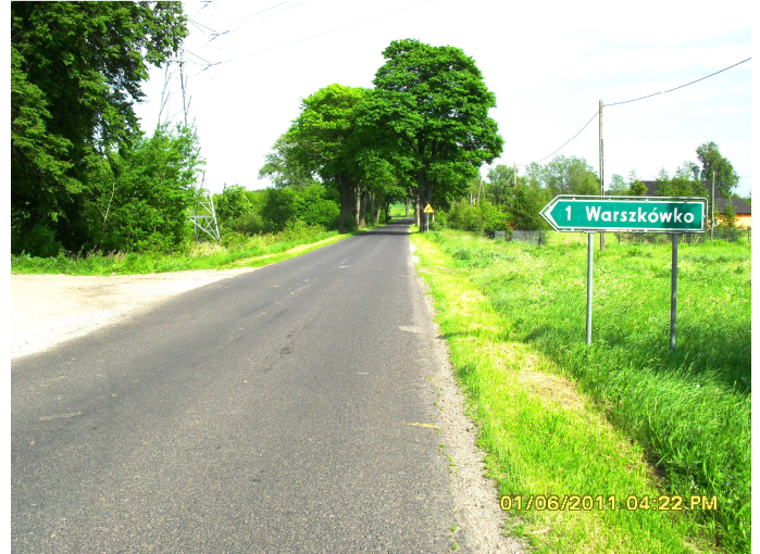
Fot. 1 i 2. Widok od strony Warszowa w kierunku na Tychowo