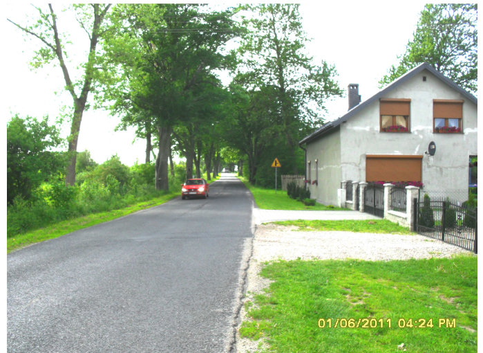
Fot. 5 i 6. Widok od strony Tychowa