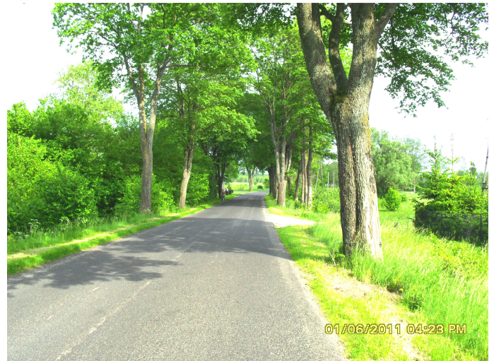
Fot. 3 i 4. Widok od strony m. Warszowo (po prawej stronie widoczny zjazd na drogę gminną nr 170025Z do Warszowa przez Kolonię Warszowo)