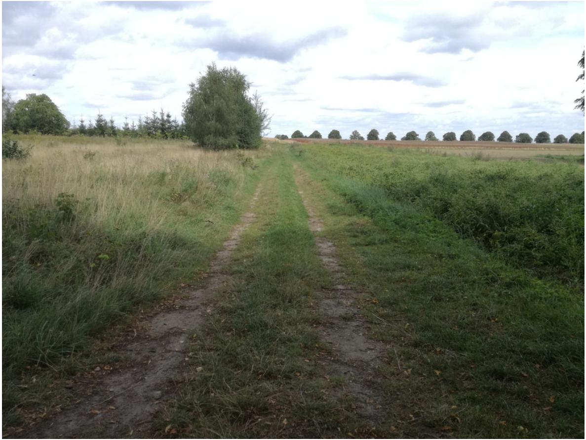
Brzeście, działka 271 – dojazd do dz. nr 90 z drogi gminnej