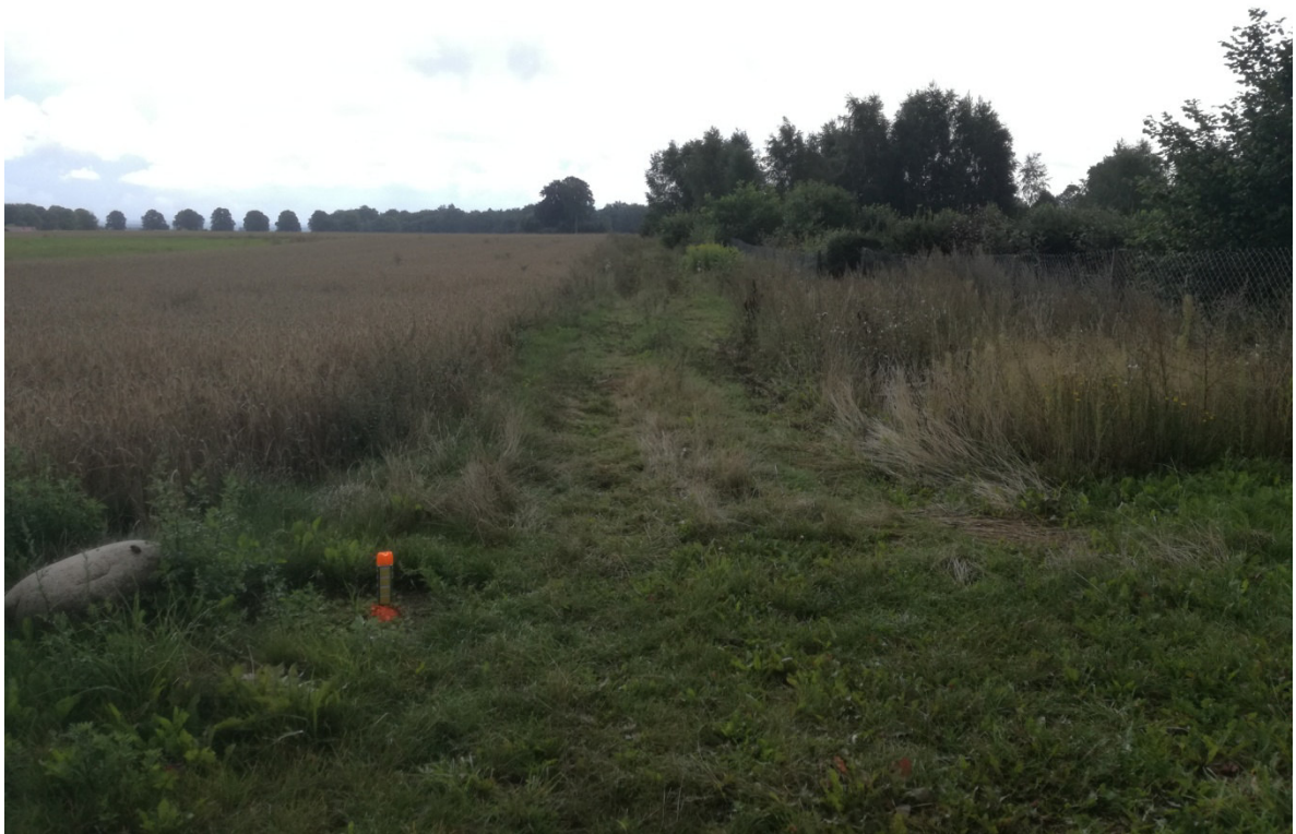
Brzeście – droga na dz. nr 271 – wjazd z drogi powiatowej