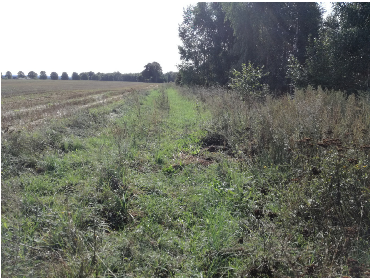
Brzeście – droga na dz. nr 217