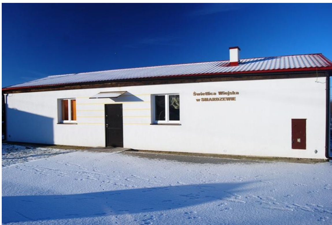
Ryc.2 Świetlica Wiejska w Smardzewie.

Dla pełnego rozwoju działalności kulturalnej niezbędna jest budowa centrum – klubu integracji społecznej.