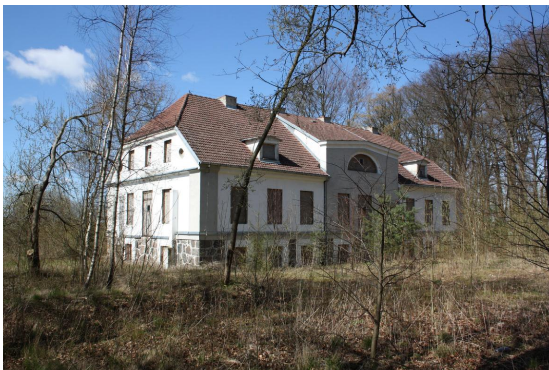
Ryc.2 Pałac w Janiewicach